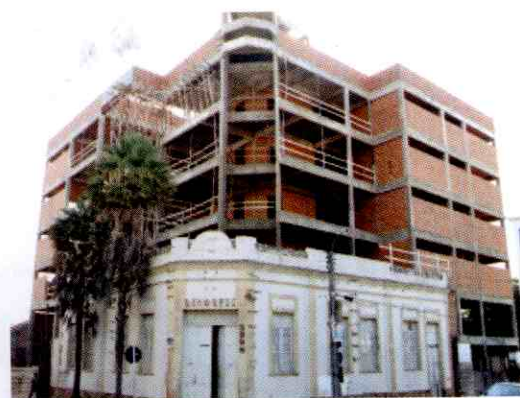
A sede da CDL em seu primeiro momento, depois da reforma e o novo prédio

No último dia 03 de março, a CDL de Teresina completou 33 anos de atividades em defesa do desenvolvimento do comércio lojista.